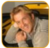
"Na het Ice Mask™ voelde mijn huid stevig en ontspannen." Victor Borsodi, Mister Zwitserland 2000