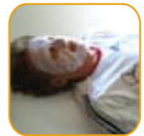
"Ik heb het Ice Mask™ gebruikt voor mijn spelers tijdens het WK 2006 en zij waren uitermate enthousiast!"